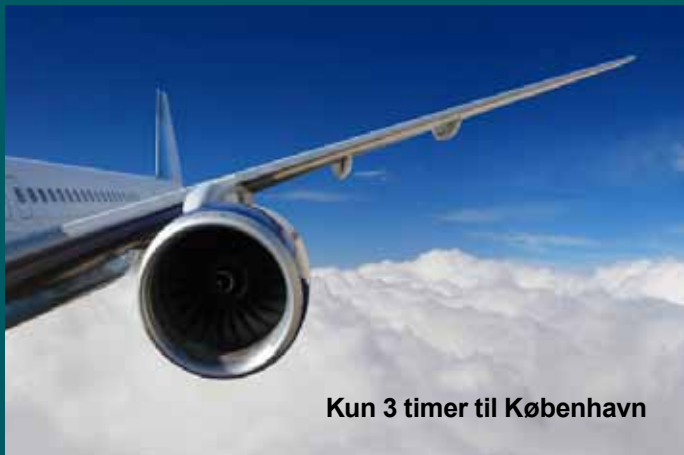
Kun 3 timer til København

Dansk kultur og islandsk kultur passer fint sammen. Her er masser af frisk luft. Fantastisk natur. Island har lidt mere brugerbetaling, men til gengæld også et lavere skattetryk. Tilbage er kun at lære sproget – men hva fa'en. Læg trykket i udtalen på første stavelse – det fremmer forståelsen! Kaaartofler eller aaaagurker.